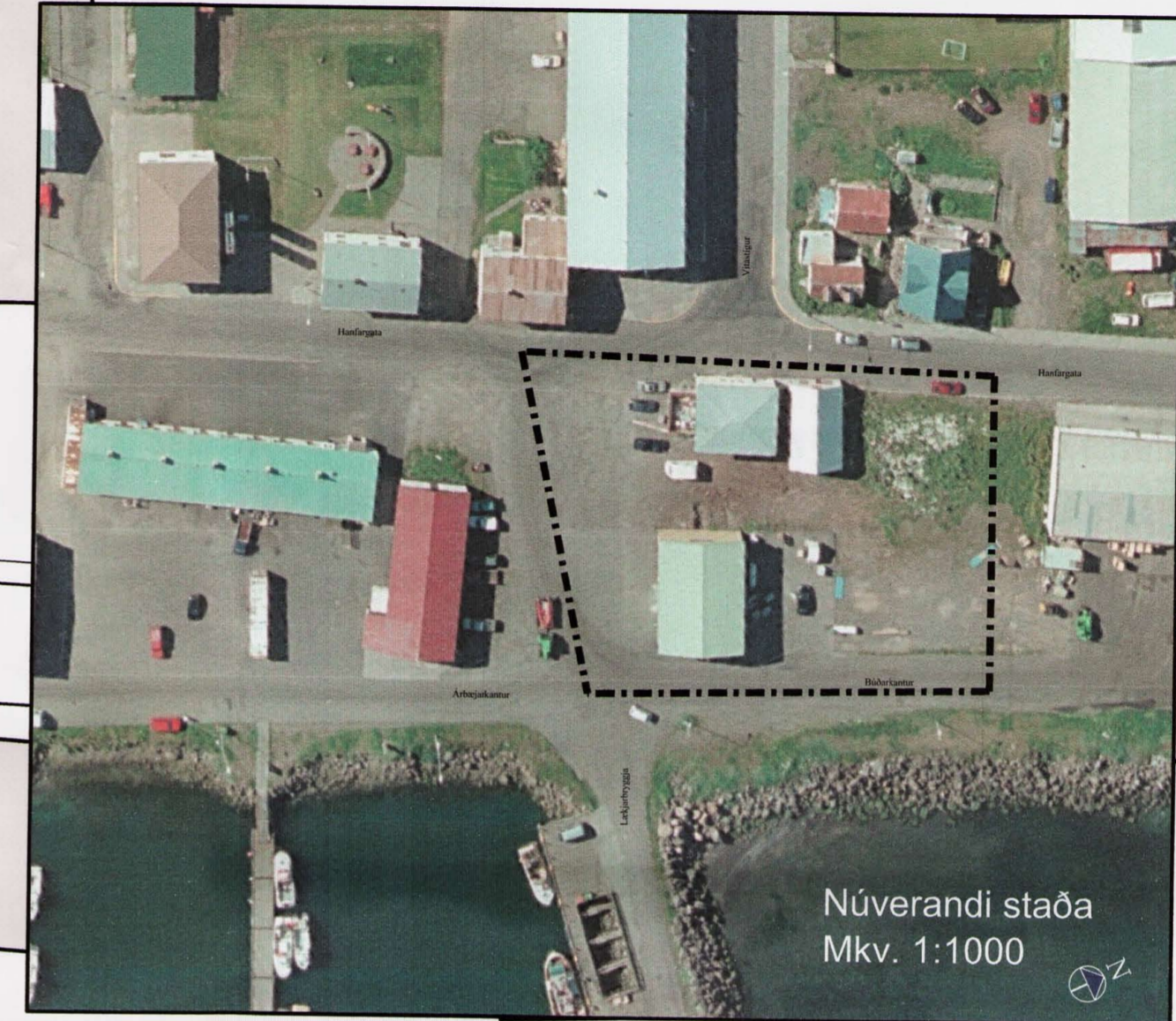
Núverandi staða Mkv. 1:1000