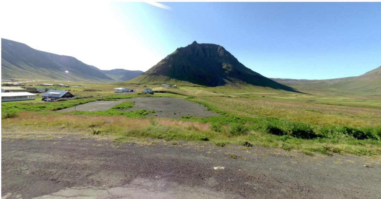
MYND 1 Hreggnasasvæði ágúst 2017.

Á grundvelli fyrirbyggjandi húsnæðisparfar lagði umhverfismálaráð til við bæjarstjórn Bolungarvíkur á vormánuðum 2021 að hafin yrði vinna við gerð nýs deiliskipulags á íbúðarsvæði við Hreggnasa. Í kjölfarið samþykkti bæjarstjórn að hefja vinnu við deiliskipulag á á Hreggnasasvæði þar sem framtíðaruppbygging íbúðarbyggðar í sveitarfélaginu mun eiga sér stað. Á sama tíma var ákveðið að hefja deiliskipulagsvinnu fyrir uppbyggingu á gístaðstöðu við Hólsá í þeim tilgangi að efla ferðaþjónustu í Bolungarvík.