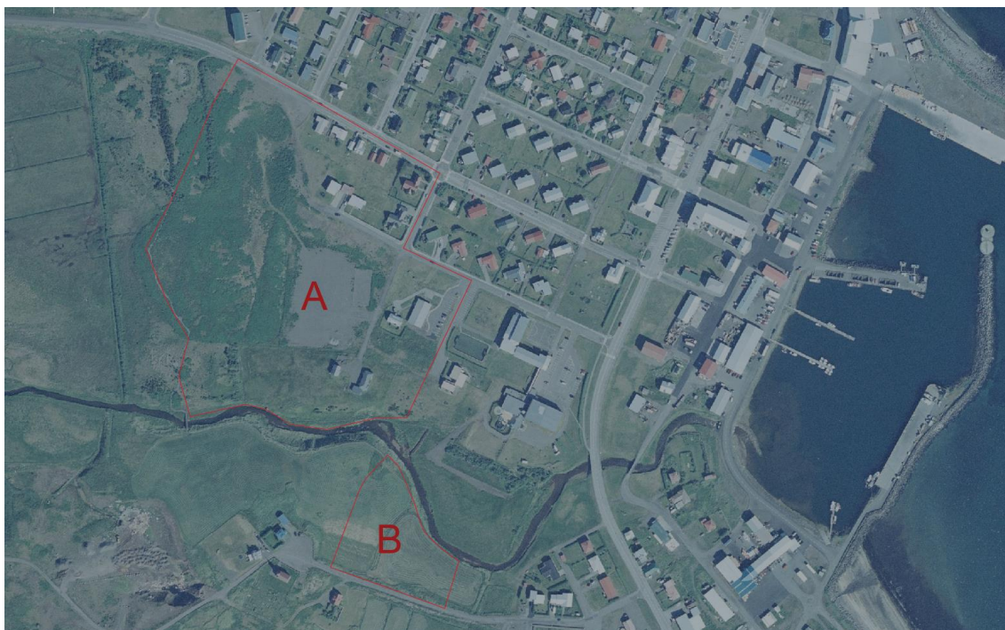
MYND 2 Áætluð afmörkun deiliskipulagsáætlana A og B.

Fyrirhuguð afmörkun deiliskipulags B markast af Hólsá til norðurs, Kirkjuvegi til suðurs en til austurs og vesturs af afmörkun VP-svæðis í aðalskipulagi. Svæðið er um 1,5 hektarar að stærð.