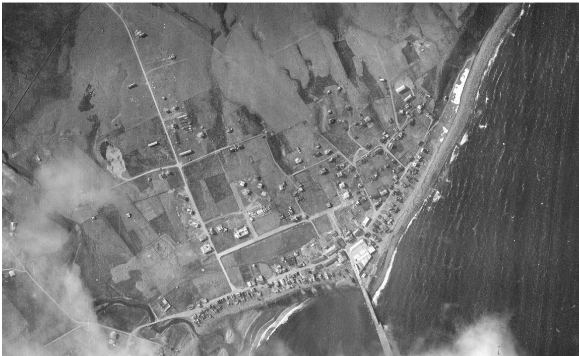
MYND 3 Loftmynd frá því um 1950

Skipulagssvæði A sem ætlað er undir íbúðabyggð er þannig staðsett að hægt verður að mynda samfellu í núverandi byggð og nýrri. Vestan við Hreggnasa var malarnám og sjást þess en skýr ummerki. Á loftmynd sem líklega er frá því um 1950 sést malargryfjan en hús við Hreggnasa eru órisin. Litlu húsín við Hafnargötu standa í fjöruborðinu og kantarnir sem við þekkjum í dag sem Ábæjarkant og Búðarkant eru ekki komnir.